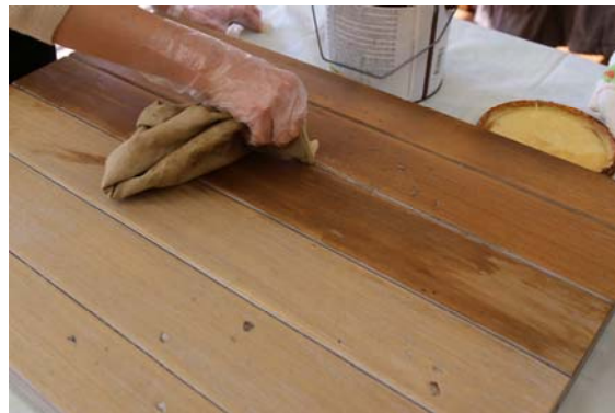
② 濡らした布で表面を拭いた後、刷毛で塗装する