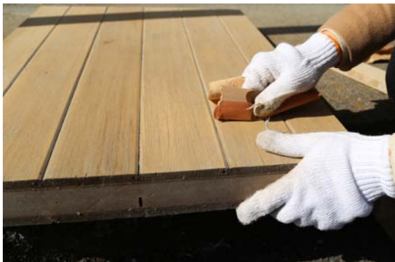
① 表面をペーパーで整える