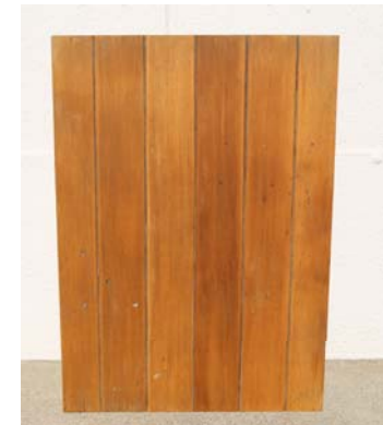
③ 塗料が乾かないうちに布で拭き取りをする