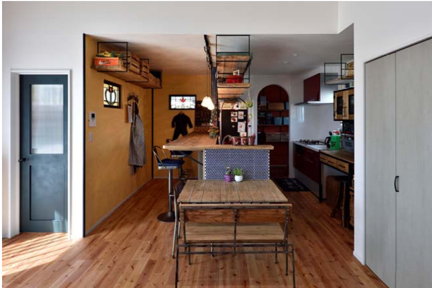
節を大胆に生かしたラスティック