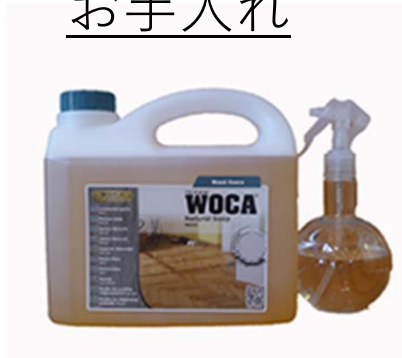
大和屋クリアソープ