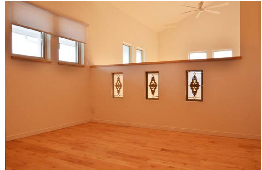
節が控えめ、上品なアーバン