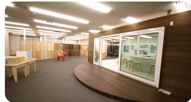
<大和屋ショールーム>

大きなサンプルで、本物ならではの質感・木のぬくもりをお確かめください。また、自社実験の経過などをご覧頂くこともできます。ぜひ、お越しください。