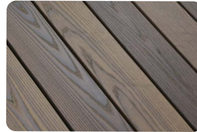
<新品サーモアッシュデッキ>

数あるアッシュの中でも、北米・ヨーロッパから素材を厳選。アッシュの美しい木目が特徴です。また、経年により色がシルバーグレーに変化します。自然木ならではの、年を重ねるごとに美しくなる「経年美化」をお楽しみいただけます。もちろん、シルバーグレーになってもアッシュの木目の美しさは変わることはありません。