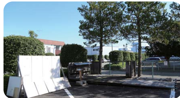
<大和屋実験スペース>