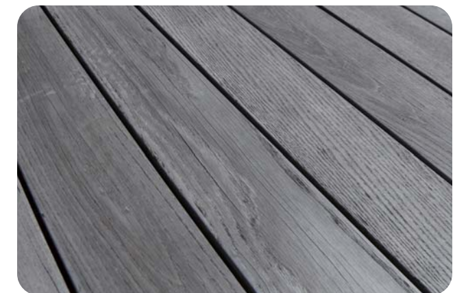
<経年変化したサーモアッシュデッキ>