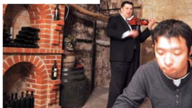
▲ レストラン内の音楽隊