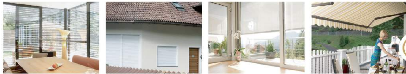
▲ ブラインドタイプ