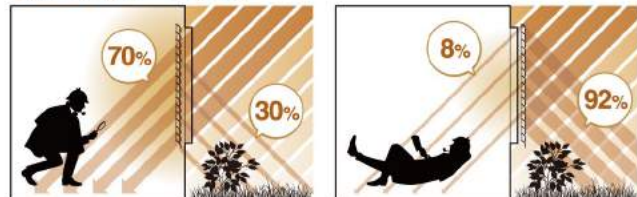
▲ 内付けブラインド