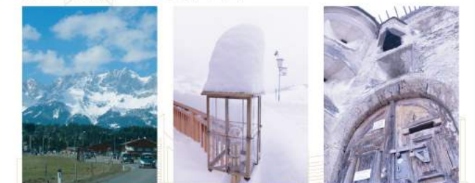
▲ 東アルプス山脈の山並み

2013年3月中旬にオーストリア西部のインスブルック近くにある会社で研修を受けてきました。チロル地方と呼ばれる地域で、東アルプス山脈の山並みがとてもきれいでした。また道の脇に目をやると、山の上に古城があったりして、その雰囲気はノスタルジックでもありました。この辺りは、オーストリア・イタリア・ドイツ・チェコなどの周辺国からスキーヤーが集まることで有名な場所で、滞在している間も豪雪が降りました。映画のワンシーンのようなきれいな風景が広がる大パノラマをご覧になりたい方、澄んだきれいな空気でリフレッシュしたい方にはお勧めの地域です。