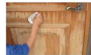
◀消毒後、ペーパーを掛けます