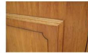
◀メンテナンス専用オイルを塗装(2~3回)