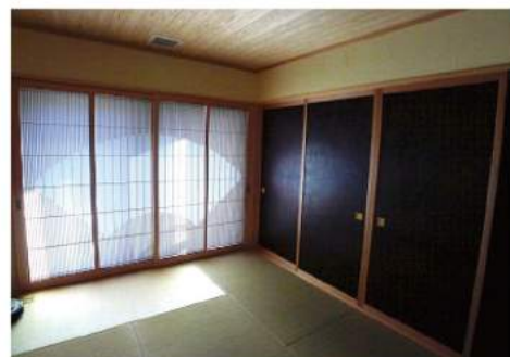
▲ おかみさんお気に入りの飾り障子