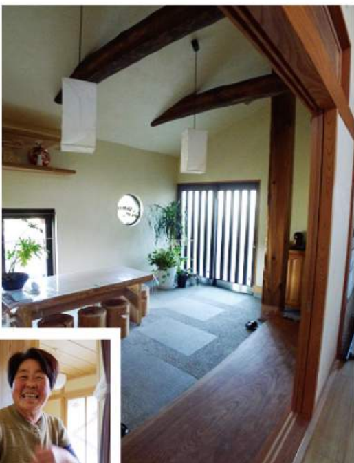
▲ ご主人こだわりの逸品が並び風格のある玄関周り